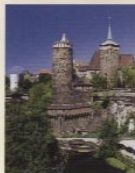
Alte Wassermühle in Bautzen

Diese Tour führt Sie immer an der Spree durch die Stadt Bautzen. Die Friedensbrücke führt an der Alten Wassermühle vorbei. Die restaurierten Häuser mit der Michaeliskirche und dem Nicolaifriedhof bilden ein nordwestliches Stadtbild. Wenige Kilometer entfernt liegt der Saurierpark mit Sauriergärten.